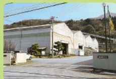
29年前に開始したPC事業は、今や屋台骨を担うまでの事業へと成長