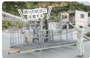
左)製品が誰もが知る建物の外壁やバルコニーを造るのだと思うと大きなやりがいを感じる 右)工程表をお互いに見ながら、当日の作業内容や鉄筋(製品)の確認をする