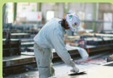
2018年には建設工事統計調査の功績から国土交通大臣感謝状を受賞