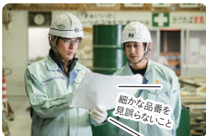
細かい品質を見逃さないこと